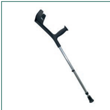
Negra Cod.: 0810000011

Muleta integral de aluminio y regulable por la parte inferior.