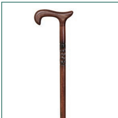
Madera clásica tallada Cod.: 0811010002