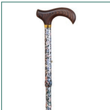
Aluminio con estampado Cod.: 0811020002