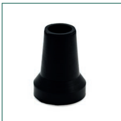
Amb ventosa N° 2 de 21 mm Cod.: 0105970211

Contera de goma con ventosa para todo tipo de bastones de 21 mm. Se fabrica en color negro.