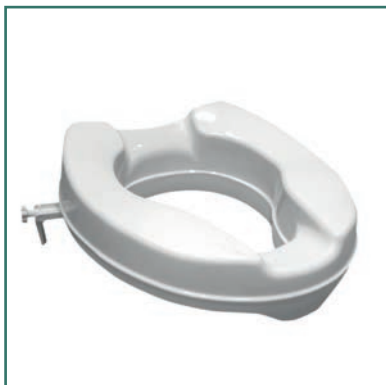
Elevador para inodoro sin tapa