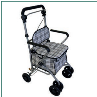
Estampado Cod.: 0820010322