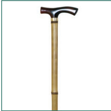
Madera de bambú con el puño de plástico Cod.: 0811010003