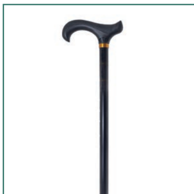
Aluminio negra y puño negro con tacto blando Cod.: 0811030005