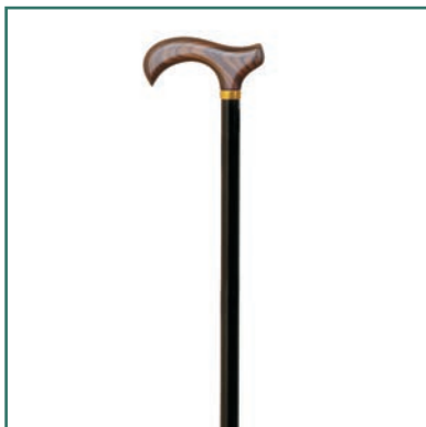
Aluminio negro y puño de plástico Cod.: 0811030001