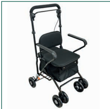
Negro Cod.: 0820010311