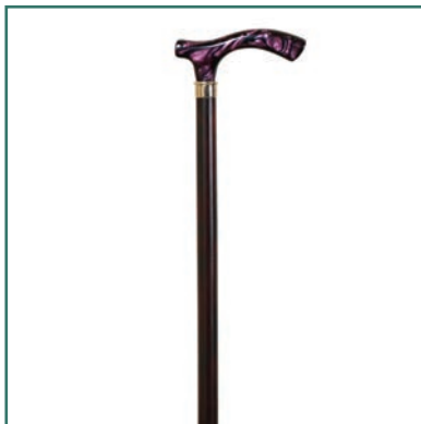
Madera con puño metacrilato Cod.: 0811010004