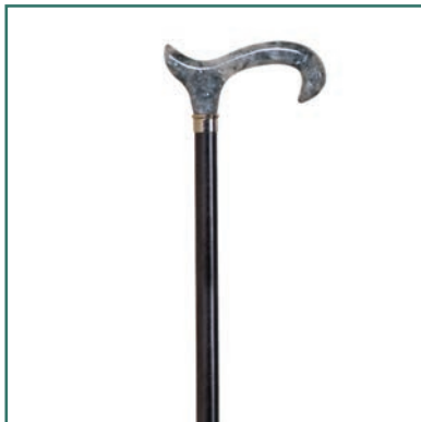
Madera derby con el puño de metacrilato Cod.: 0811010005