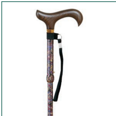
Aluminio estampado cachemir y puño de madera (mini) Cod.: 0811020013