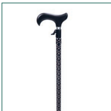
"Stand Up" negro y dorado con puño negro Cod.: 0811030007