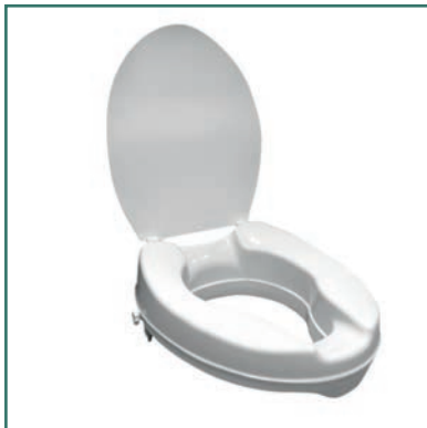
Elevador para inodoro con tapa