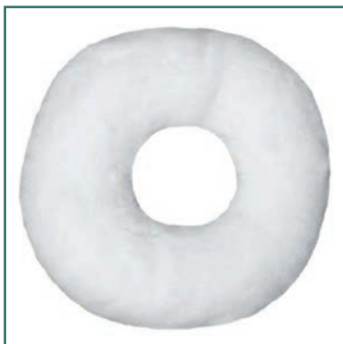
Anillo Cod.: 0840100101

Recomendado para personas que deben permanecer en la misma posición largos periodos de tiempo.