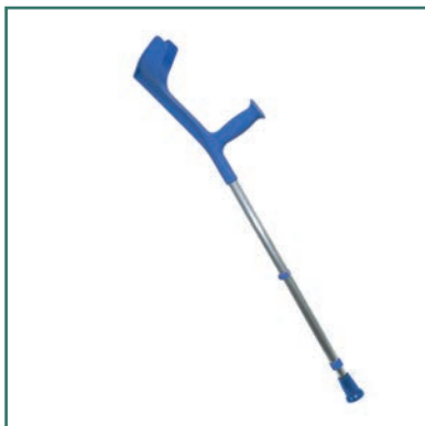
Azul Cod.: 0810000017

Muleta integral de aluminio y regulable por la parte inferior.