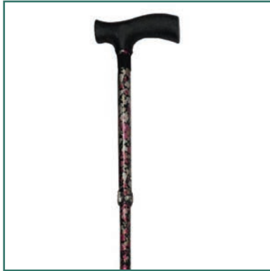
Aluminio con estampado de flores y puño de plástico negro Cod.: 0811020004