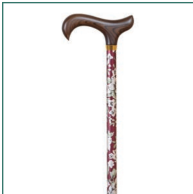
Aluminio con estampado de flores y puño de madera Cod.: 0811030002