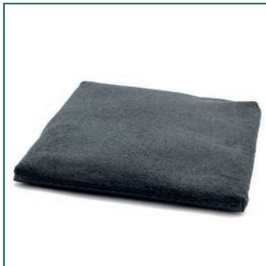
Cojín de gel cerrado Cod.: 0012454517

El cojín de gel antiescaras en forma de herradura, está diseñado de forma que crea un efecto micromasaje y permite el reparto equilibrado de presiones. Es antialérgico y dispone de una funda de plástico lavable. Recomendado para prevenir o aliviar las úlceras de presión y para facilitar una correcta postura al sentarse.