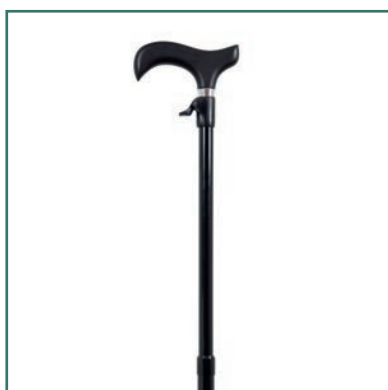
"Stand Up" negra y puño negro Cod.: 0811030006