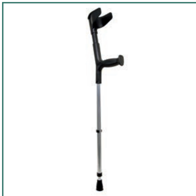
Normal Cod.: 0810010011

Muleta de aluminio extensible en dos partes.