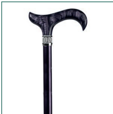
Aluminio morado y puño con anilla de cristal Cod.: 0811020006