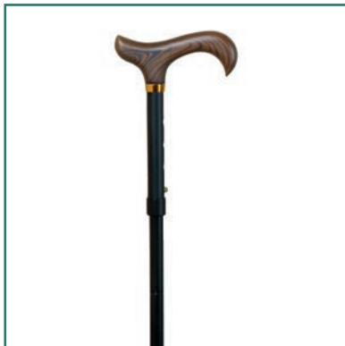
Aluminio negra y puño de madera (mini) Cod.: 0811020005