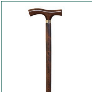
Madera de haya con anilla Cod.: 0811010001