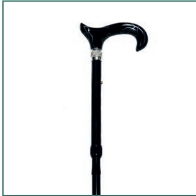
Aluminio negro y puño con anilla de cristal Cod.: 0811020007