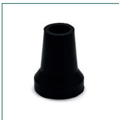
Amb ventosa N° 1 de 18 mm Cod.: 0105970111

Contera de goma con ventosa para todo tipo de bastones de 18 mm. Se fabrica en color negro.