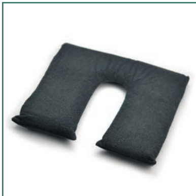
Cojín de gel abierto Cod.: 0011454517

El cojín de gel antiescaras en forma de herradura, está diseñado de forma que crea un efecto micromasaje y permite el reparto equilibrado de presiones. Es antialérgico y dispone de una funda de plástico lavable. Recomendado para prevenir o aliviar las úlceras de presión y para facilitar una correcta postura al sentarse.