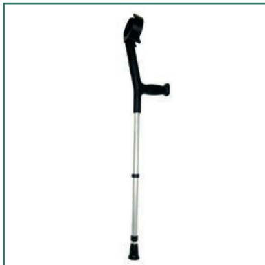
Codo articulado Cod.: 0810010111

Muleta de aluminio extensible en dos partes y con el codo articulado para una buena adaptación de los movimientos del brazo sin tener que soltar la mano del bastón.