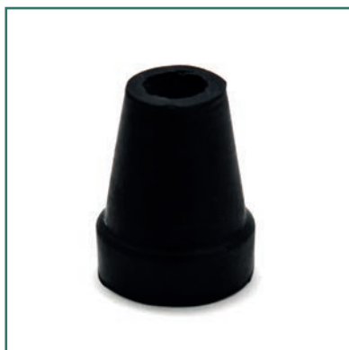
Con ventosa N° 0 de 16 mm Cod.: 0105970011

Contera de goma con ventosa para todo tipo de bastones de 16 mm. Se fabrica en color negro.