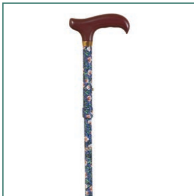
Aluminio con estampado de flores y puño de madera (mini) Cod.: 0811020003