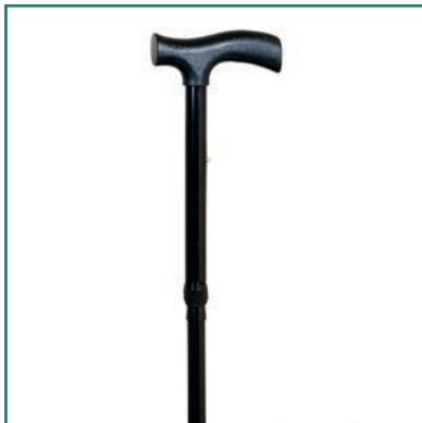
Aluminio negro puño de plástico negro Cod.: 0811020001