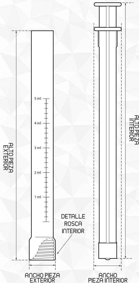
VISTA DE LAS PIEZAS